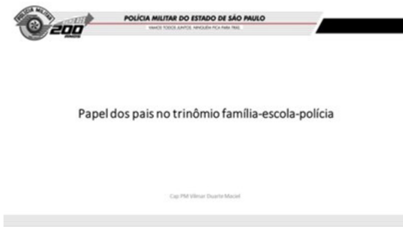
Figura 4 — Palestra de engajamento dos pais

Apenas singelos exemplos de palestras são as seguintes (figuras 4 e 5), elaboradas no aplicativo Power Point, da Microsoft®: