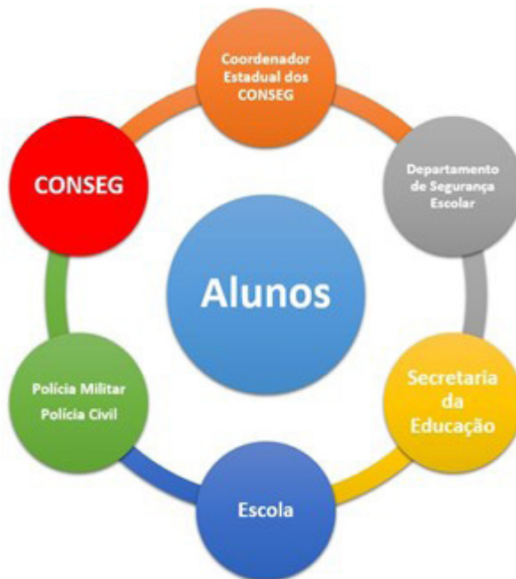
Figura 3 — Representação visual do DSE proposto

A fixação do conceito de multiagências, para integração de autoridades vitais ao pleno desenvolvimento do PVSE pretendido (nos moldes do que é aplicado no 54º BPM/I), com a criação do Departamento de Segurança Escolar (DSE), atrelado ao CONSEG local, que pode ser representado pelo diagrama a seguir: