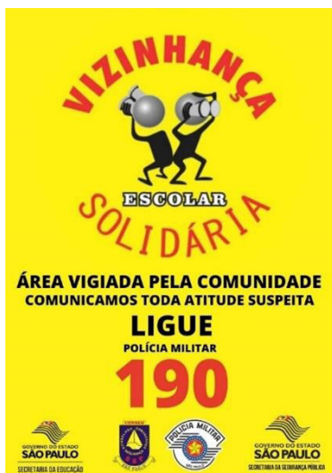
Figura 1 — Placa do PVSE