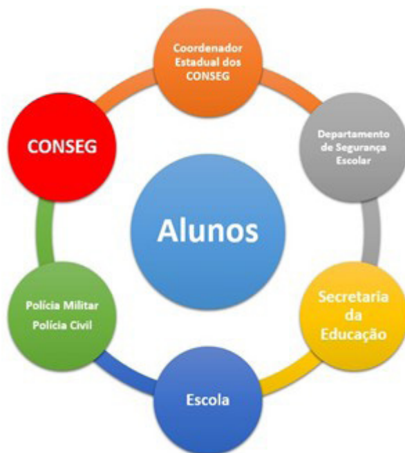
Figura 3 — Representação visual do DSE proposto

A fixação do conceito de multiagências, para integração de autoridades vitais ao pleno desenvolvimento do PVSE pretendido (nos moldes do que é aplicado no 54º BPM/I), com a criação do Departamento de Segurança Escolar (DSE), atrelado ao CONSEG local, que pode ser representado pelo diagrama a seguir: